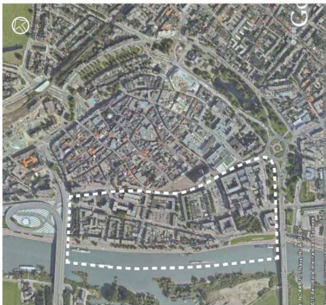
De zogenaamde Rijnboog, het gebied tussen de Arnhemse binnenstad en de Rijn